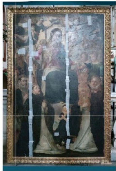
La Pala lignea oggetto dell'intervento