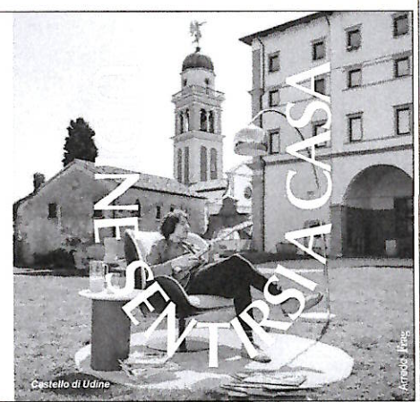
Castello di Udine