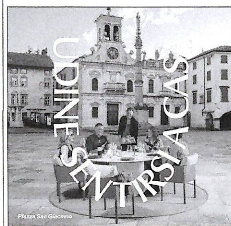
Piazza San Giacomo