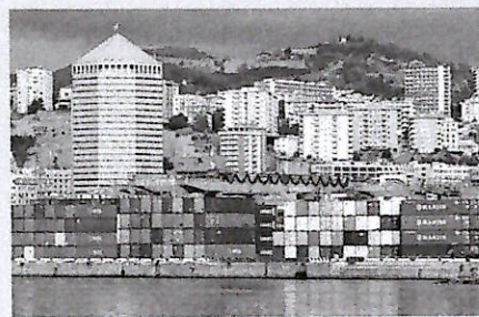
In declino Nel 2025 l'avvio dei dazi tariffari statunitensi voluti dall'amministrazione Trump ha rivoluzionato il commercio

Il surplus commerciale (la differenza tra quanto l'Italia vende all'estero e quanto compra, ndr) verso