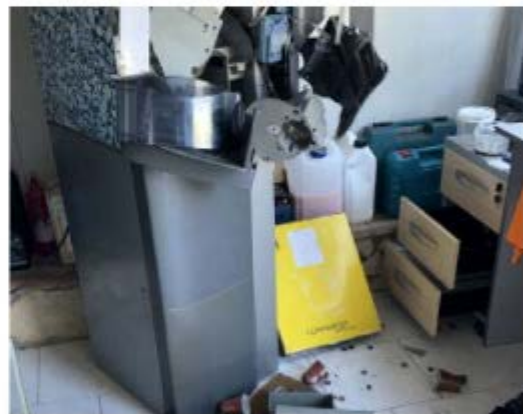
Uno dei distributori distrutti dai ladri