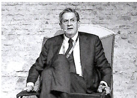
Roberto Tasca è il presidente della multiutility lombarda A2A

«Oggi soprattutto dal fotovoltaico. Grazie alla posizione del nostro Paese, possiamo realizzare impianti da Nord a Sud, senza trascurare i tetti con autoconsumo. Così come si potrebbero abilitare impianti di taglia maggiore, ad esempio al nord. Il nostro problema non è reperire i capitali: abbiamo disponibilità di investimento e la volontà di farlo, abbiamo bisogno che qualcuno ci metta nelle condizioni di investire. Bisogna puntare anche sull'eolico, risorsa che ha un profilo di produzione che in parte manca nel nostro mix energetico. Il nucleare è un'ipotesi interessante da valutare, ma non è realizzabile almeno nel prossimo decennio. Le rinnovabili sì. Inoltre, dobbiamo investire sulle reti, perché uno dei veri nodi è la connessione: siamo più connessi con l'estero che all'interno del Paese. Se la produzione fotovoltaica è concen-