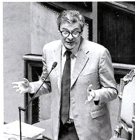
Allavoro il ministro dell'Economia e delle Finanze, Giancarlo Giorgetti, ha chiesto all'Europa un cambio di rotta sostanziale

La questione del caro-energia resta alta nell'agenda delle istituzioni Ue, anche in vista del Consiglio europeo in programma la prossima settimana, durante il quale ci sarà una sessione dedicata al tema della competitività.