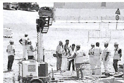
Confronto tra operai e tecnici nel cantiere. Sotto l'area dove sarà realizzato l'hangar di Gbl. A sinistra, lavori sulla colmata