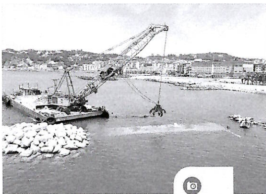
A destra e sinistra, l'intervento a mare per completare la scogliera davanti alla colmata di Bagnoli

team e per l'evento stesso, ma il tempo stringe mentre ci prepariamo per la navigazione e lo sviluppo della barca principale, l'AC75, in autunno, che è fondamentale».