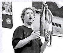
Mark Zuckerberg (Meta)

L'inchiesta era stata aperta nel dicembre scorso dopo che — a partire dal 15 ottobre