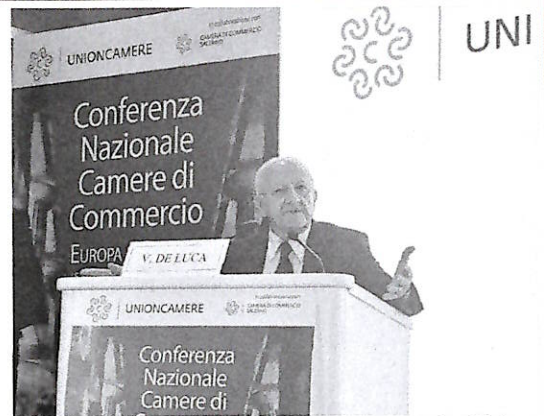
● Vincenzo De Luca alla sua prima uscita pubblica da neo sindaco di Salerno

Prima di De Luca è Letta che entra nel cuore della questione dei giovani in viaggio verso l'estero. Il presidente Arel racconta la sua esperienza di preside di una università a Madrid: «Dobbiamo invertire la rotta ottenendo che i ragazzi restino in Italia e attirare talenti da fuori. La Spagna cresce di più perché si è aperta all'America Latina, nel mio staff ho trentenni molto competen-