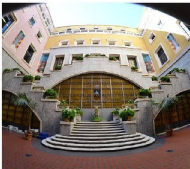
Il Comune di Salerno