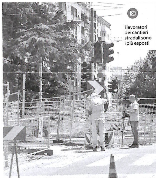
I lavoratori dei cantieri stradali sono i più esposti

«Tutti quelli legati alla qualità del suolo e alla disponibilità di acqua: l'agrifood su tutti. A Bordeaux siamo arrivati a 43,3 gradi: l'impatto sul vino è devastante. La filiera del caffè è già stata travolta dal climate change, ma anche quella della moda per l'approvvigionamento di cuoio, seta, cotone. E poi le costruzioni per il legno».