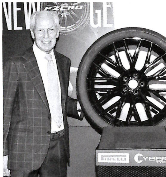
Marco Tronchetti Provera verso la presidenza di Pirelli