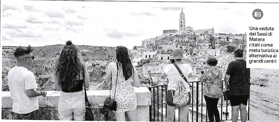
Una veduta dei Sassi di Matera citati come meta turistica alternativa ai grandi centri