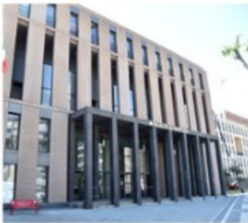
Sopra il Tribunale di Salerno; a destra il cantiere del ripascimento