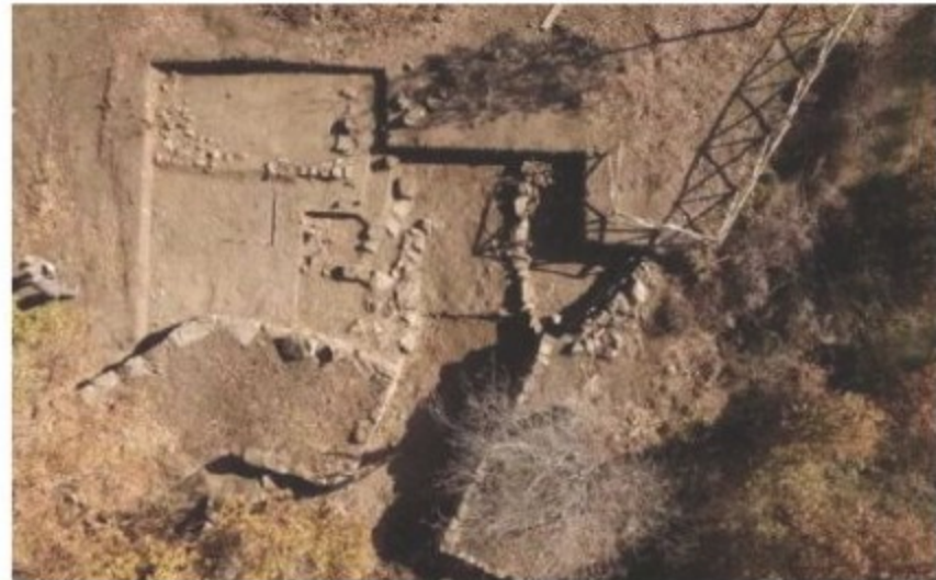
L'area del sito di Monte Pruno a Roscigno

Banca e Fondazione Monte Pruno al fianco della ricerca. Albanese: «Patrimonio identitario della comunità»