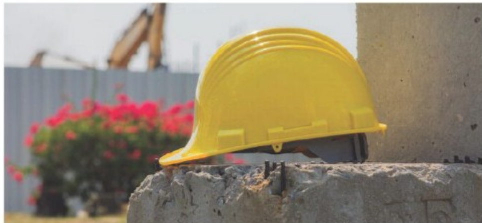
Sanzioni da 118mila euro dopo il blitz nel complesso edilizio di lusso sulle colline di Salerno