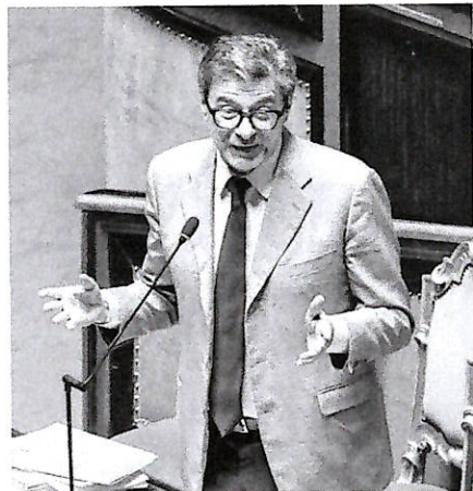
All lavoro Il ministro dell'Economia e delle Finanze, Giancarlo Giorgetti, ha chiesto all'Europa un cambio di rotta sostanziale

La questione del caro-energia resta alta nell'agenda delle istituzioni Ue, anche in vista del Consiglio europeo in programma la prossima settimana, durante il quale ci sarà una sessione dedicata al tema della competitività.