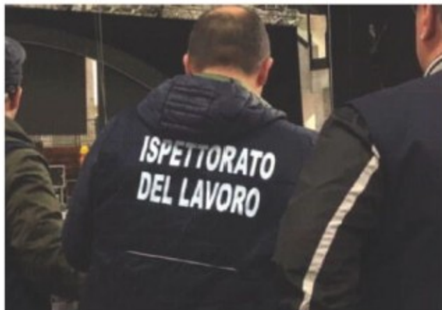
I controlli degli uomini dell'Ispettorato del lavoro