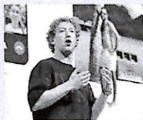
Mark Zuckerberg (Meta)

L'inchiesta era stata aperta nel dicembre scorso dopo che - a partire dal 15 ottobre