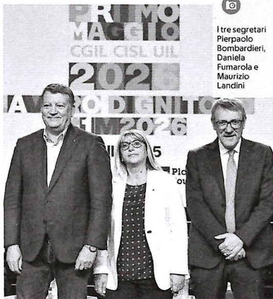
I tre segretari Pierpaolo Bombardieri, Daniela Fumarola e Maurizio Landini