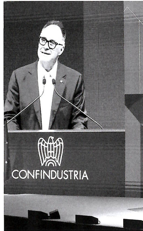
Il discorso Il presidente Emanuele Orsini durante l'assemblea annuale di Confindustria al centro congressi della Nuvola (Roma) Tra i partecipanti il capo dello Stato, Sergio Mattarella, la premier Meloni, ministri, manager e sindacalisti

delle cose richiede fiducia e coraggio politico». Poi si deve guardare anche ai risparmi privati e ai fondi pensioni che con i giusti incentivi potrebbero, a loro volta, sostenere investimenti produttivi. All'Europa Orsini invece torna soprattutto a chiedere la sospensione degli Ets, la tassa sulle emissioni di carbonio, in modo da evitare la chiusura o la delocalizzazione di tante imprese. Quindi, sollecita la creazione di un mercato uni-