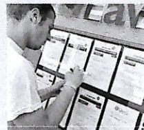
L'Italia resta indietro sullavoro

È una fotografia in chiaroscuro quella che emerge dall'ultimo Bilancio di genere pubblicato dalla Ragioneria dello Stato, che dall'analisi delle dichiarazioni dei redditi trova un'ulteriore conferma del divario socio-economico che caratterizza il nostro Paese. Ovvero che le donne, che pur essendo quasi la metà dei contribuenti, percepiscono redditi di gran lunga inferiori a quelli degli uomini. A fornire un'istantanea