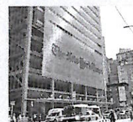
Lasede del New York Times

“Non capitolate al presidente Usa” L'appello del Nyt