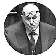
Guido Crosetto Ministro della Difesa

Metteremo a disposizione l'esperienza acquisita nelle missioni navali europee