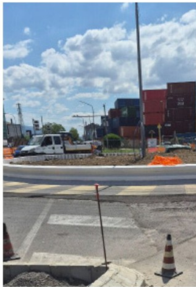
La nuova rotatoria a Fuorni; a sinistra, il traffico nella zona

Ancora più dura la posizione degli autotrasportatori. I mezzi pesanti, che rappresentano una componente significativa del traffico nell'area industriale, faticano a imboccare correttamente la rotatoria. «Con un bilico non è semplice ma-