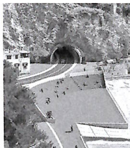
Rendering del progetto

Costiera amalfitana, polemiche per il progetto promosso dal sindaco Previsto anche un parcheggio di 200 posti