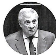
Antonio Tajani Ministro degli Esteri

Metteremo a disposizione l'esperienza acquisita nelle missioni navali europee