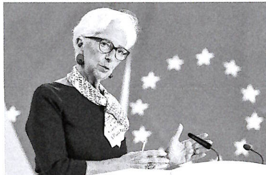
La presidente della Bce, Christine Lagarde

La presidente Bce boccia la richiesta di un allentamento fiscale contro lo shock energetico. Per gli analisti anche con l'intesa su Hormuz serviranno mesi per la normalità