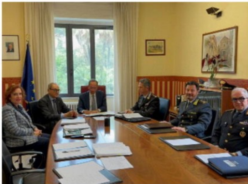
La firma del protocollo ieri mattina in Prefettura

Patto Prefettura-Comune: si alzano i controlli contro gli investimenti in città di capitali illeciti