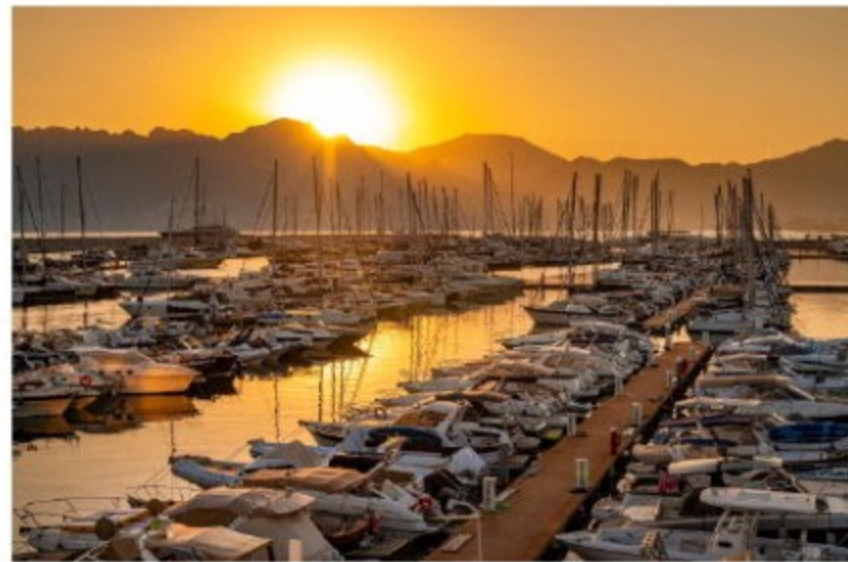
Il porto Marina d'Arechi conferma la Bandiera Blu e rilancia per l'estate 2026

Importante restyling anche per la "Marina Beach", oggi ancora più verde, accogliente e dotata di ristorante privato sulla spiaggia. Per gli amanti dello sport, al campo di padel si affianca una nuovissima palestra, in una cornice arricchita da sei nuovi summer shops. Rinnovato anche l'ampio parcheggio interno, servito da una navetta gratuita. «Marina d'Arechi continua a crescere come spazio aperto alla città, coniugando nautica, accoglienza e tempo libero», sotto-