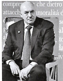
Il ministro della Difesa Guido Crosetto

senza l'egida delle Nazioni Unite, ribadisce Crosetto alla presentazione del libro di Carlo Calenda "In difesa della libertà" (in barba alle proteste dell'opposizione): «Ho la totale certezza che sarebbe molto meglio con il mandato dell'Onu, ma può essere bloccato in consiglio di sicurezza dal primo che si alza». E quindi non ha dubbi il titolare della Difesa: «Serve pragmatismo, Hormuz si può mettere in sicurezza con una coalizione internazionale con 30 o 50 nazioni». Non solo europee, aggiunge il ministro, perché «lo stretto di Hormuz è un problema per tutto il mondo, soprattutto per l'Asia». E tuttavia, come ha anticipato Repubblica, non è escluso «ed è l'opzione caldeggiata da Palazzo Chigi - che Unione europea possa intervenire, ridefinendo alcune missioni già esistenti.