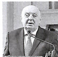
Gilberto Pichetto Fratin Ministro dell'Ambiente e della Sicurezza energetica

Il ministro dell'Ambiente: “Il blocco dello Stretto di Hormuz problema serio Superare le barriere burocratiche che frenano l'uso dell'energia verde”