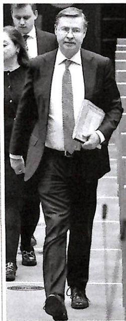
Il titolare dell'economia Ue Valdis Dombrovskis, 55 anni, politico lettone, è commissario europeo all'Economia. Per ora si è detto contrario a qualsiasi stop al patto di stabilità

per la pandemia». Altro assist a Giorgetti, che non a caso parla di «una risposta unitaria europea come fu fatto per la pandemia con misure eccezionali». Il riferimento è al Recovery Fund, debito comune europeo per finanziare la ripresa. Infine l'allineamento con la condizione posta dal Patto per attivare la clausola di salvaguardia che consente agli Stati membri di deviare dal percorso della spesa netta. Quindi la sospensione delle regole - precisa la premier - «se ci sarà una nuova recrudescenza» del conflitto. Giorgetti la mette giù così: «Nel caso di prolungato stress sulle finanze pubbliche del nostro Paese o di recessione severa» in Europa.