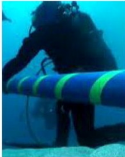
L'intervento di Terna

corrente continua a 500 kV, estendendosi per circa duemila chilometri di tracciato sottomarino. Il ramo est è inoltre uno dei tre progetti di Terna inseriti nel programma europeo REPowerEU, a conferma della valenza strategica dell'opera anche a livello comunitario, con un finanziamento di 500 milioni di euro. Il Tyrrhenian Link contribuirà al raggiungimento degli obiettivi di decarbonizzazione definiti dal Piano Nazionale Integrato per l'Energia e il Clima (PNIEC).