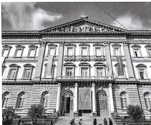
● L'università Federico II

Un passaggio tutt'altro che secondario: il sistema elettorale federiciano prevede una platea articolata di elettori, in cui ai professori e ricercatori si affianca una quota del personale tecnico-amministrativo. In base ai dati aggiornati all'8 aprile, i docenti e ricercatori con diritto di voto sono 2.541; il 2 per cento corrisponde a 51 unità, ovvero il numero dei rappresentanti da eleggere nelle consultazioni per i "grandi elettori", fissate per il 21 e 22 maggio (dalle 9 alle 17 il primo giorno e dalle 9 alle 14 il se-