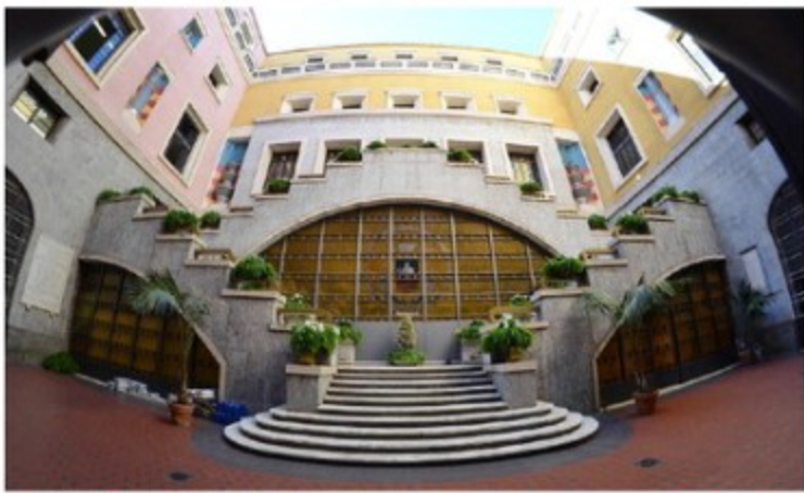
Il Comune di Salerno; in basso, il commissario prefettizio Vincenzo Panico

In concreto, per quanto riguarda la refezione scolastica e il trasporto scolastico, è stato stabilito che «l'erogazione dei servizi sia garantita dal primo ottobre al 31 maggio» - anche se molte scuole continuano le attività fino a metà giugno. Poi, venendo ai conti, emerge come non esista più nessuna fascia di reddito esente: pagano tutti, anche i meno abbienti. Come si legge nella delibera, infatti, si «modifica la prima fascia di contribuzione al costo del servizio di refezione scolastica, attualmente esente, con l'introduzione della quota unitaria di 1,30 euro per ciascun pasto a carico degli utenti con Isee da 0,00 a 8.000 euro» che, finora, avevano pagato una quota