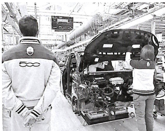
La linea di produzione della 500 nello stabilimento Mirafiori di Torino

Il segretario della Fim-Cisl, Ferdinando Uliano, chiede «che si chiariscano i tempi per le nuove Alfa Giulia e Stelvio, anticipando il lancio del nuovo modello di alta gamma». E sui possibili interventi da parte di nuovi soci, ad iniziare dai cinesi di Leapmotor, Uliano non si scompone: «Siamo aperti a discutere, soprattutto se una collaborazione con Leapmotor o con altri accelera modelli e porta lavoro». Uliano, in vista della