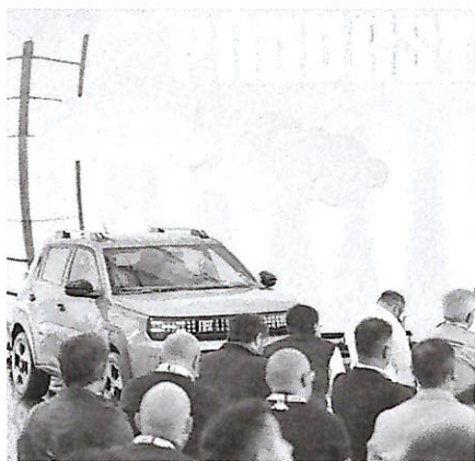
La presentazione della Grande Panda ibrida

Fiat scommette sulla Grande Panda, che sarà un modello globale con lo scopo di rendere più accessibile la transizione verso l'elettrico. «Puntiamo a venderne a pieno regime 300 mila unità all'anno in tutto il mondo, creiamo occupazione. È un progetto con rilevanza sociale: ci serviranno almeno tre impianti, uno per ogni area, con ricadute su componenti, vendite e assistenza», sottolinea Olivier Francois, responsabile del marchio Fiat di Stellantis, alla presentazione della nuova Grande Panda ibrida a Mirafiori. «In Europa siamo sulla buona strada - evidenzia il manager - ma l'obiettivo è globale. Quest'anno la lancia-