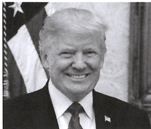
Donald Trump è stato rieletto presidente degli Stati Uniti