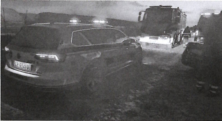
Il luogo dell'incidente

Ancora un incidente sul lavoro. La vittima è un bracciante agricolo di nazionalità indiana. La tragedia si è consumata ieri pomeriggio in località Campolongo, frazione del Comune di Eboli. Si tratta