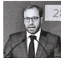
ANTOINE ARMAND MINISTRO FRANCESE DELL'ECONOMIA

I produttori impegnati nell'elettrificazione non dovrebbero dover pagare multe o sanzioni nel 2025