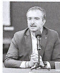
Riccardo Molinari (Lega)

S e la proposta verrà fatta propria dal governo, potrebbe essere l'ultimo tassello per il via libera ai lavori del Ponte sullo Stretto. Ieri il sì della valutazione di impatto ambientale, oggi l'emendamento alla legge di Bilancio, primo firmatario il capogruppo leghista alla Camera Riccardo Molinari: «Per consentire l'approvazione del progetto del Ponte entro quest'anno è autorizzata una spesa complessiva di circa 14,7 miliardi di euro fino al 2032, di cui 7,7 miliardi reperiti dalle risorse del Fondo per lo sviluppo e la coesione, periodo di programmazione 2021-2027». Detta più chiaramente: per finanziare la co-