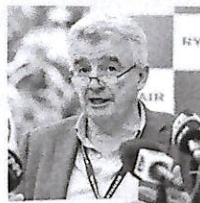
Michael O'Leary (Ryanair)

Inoltre, tutti i consumatori che nello stesso periodo hanno effettuato prenotazioni di un volo (che sono state in totale oltre 100.000) e il check-in in aeroporto, pagando il relativo supplemento, ricevevano un ristoro di 15 euro o, in alterna-