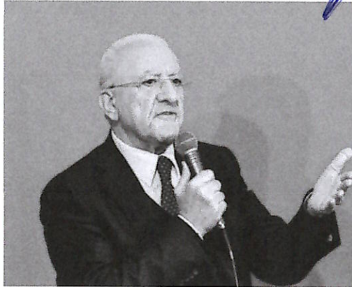
Vincenzo De Luca

pania aveva lamentato la mancanza di un meccanismo di correzione dell'entità delle risorse nell'ipotesi in cui le stesse fossero risultate eccedenti rispetto a quanto necessario per l'espletamento delle funzioni. Viene inoltre rilevata l'illegittimità della previsione della mera facoltà, e non dell'obbligo, per le Regioni ammesse alla firma dell'Intesa, di concorrere agli obiettivi di finanza pubblica. «Con riferimento alla portata dei poteri delle Camere, del tutto svolti dalla formulazione della legge Calderoli, la pronuncia in sede di interpretazione delle norme chiarirà l'altro - che il Parlamento non sarà tenuto a ratificare o meno l'Intesa, ma potrà modificarne il contenuto - ha spiegato il governatore - Analogamente, in sede interpretativa, la Corte correggerà la portata della legge in ordine alle materie cosiddette no-Lep chiarendo che i relativi trasferimenti di funzioni non