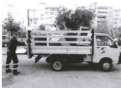
Un addetto di Salerno Pulita al lavoro