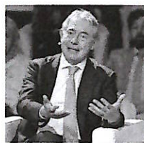
ADOLFO URSO MINISTRO DELLE IMPRESE E DEL MADE IN ITALY

Stellantis si assume la responsabilità del rilancio del settore auto in Italia. Pronti a chiudere l'accordo a Palazzo Chigi