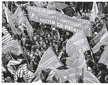
A Firenze uno sciopero del comparto moda, indetto da Cgil, Cisl e Uil

L'unica spesa pubblica che aumenta è per le armi. La trovo una cosa inaccettabile