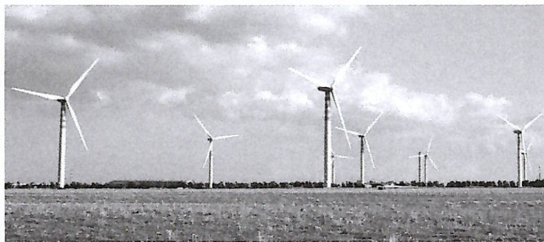
▲ Rinnovabili Un parco eolico

Una visione che si riflette bene nell'aggiornamento del Pniec, il Piano nazionale integrato energia e clima, che il governo ha inviato il primo luglio alla Commissione Ue. Un piano che, secondo Re Rebaudengo, manca di ambizione dato che «non rispetta l'urgente ne-