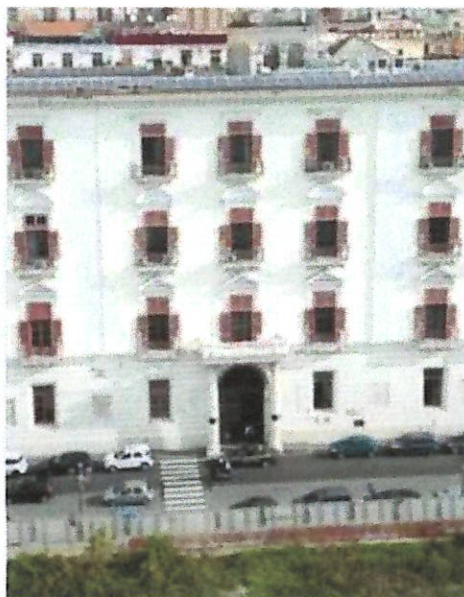
I finanziari a Palazzo Sant'Agostino, sede della Provincia di Salerno