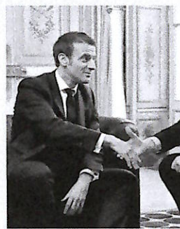
MICHEL BARNIER PRIMO MINISTRO DELLA REPUBBLICA FRANCESE

Il primo ministro ha però cercato di mostrarsi rassicurante, promettendo che tutte le scelte verranno prese «insieme alle collettività locali, non contro di loro» o