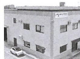
▲ Caivano Lo stabilimento Megatron Sensors