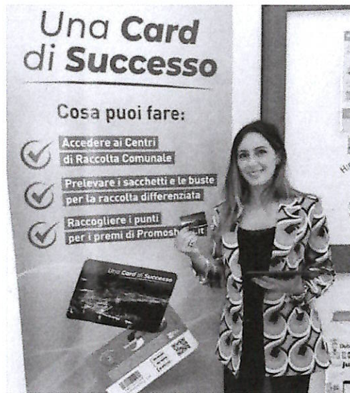
Una card di successo

Salerno Pulita e Promoshops, mano nella mano, stringendo un'unica card per premiare i cittadini virtuosi. La "card di successo", iniziativa promossa dalla società che si occupa dei rifiuti e non solo, premia gli sforzi dei salernitani in materia di raccolta differenziata e di miglioramento del decoro urbano per fare sempre più passi in avanti. L'intesa con Promoshops che consente ai cittadini di raccogliere punti ed accedere ad una serie di scontistiche viene rilanciata in questi giorni a Salerno con una serie di attività. Sia presso i centri di raccolta mobile, le tappe itineranti che Salerno Pulita, ogni sabato effettua nei diversi rioni del comune capoluogo, sia presso i centri di raccolta Fratte e Arechi è possibile trovare rappresentanti della Promoshops che potranno fornire dettagli ed informazioni e conoscere meglio il programma. Un invito rivolto anche ai titolari di esercizi commerciali che sono interessati ad entrare a far parte del circuito. Salerno Pulita ricorda che la card, consegnata a ogni nucleo familiare con utenza domestica Tari, permette ai cittadini di accedere ai centri di raccolta comunale situati a Fratte e in zona Arechi sia per il conferimento di materiali ingombranti, piccoli rifiuti Raee e inerti sia per ritirare i kit buste per la raccolta differenziata. Subito dopo, registrandosi sul portale PromoShops.it o scaricando l'applicazione da smartphone