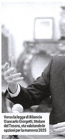
Verso la legge di Bilancio Giancarlo Giorgetti, titolare del Tesoro, sta valutando le opzioni per la manovra 2025

cia. Durissimo il capogruppo del Partito democratico Francesco Boccia: «E' l'ennesimo favore agli evasori, un assaggio della prossima manovra che verrà pagata dai più deboli». Boccia denuncia le coperture indicate per il ravvedimento: «Prendono 900 milioni dal fondo compensativo per la pressione fiscale».