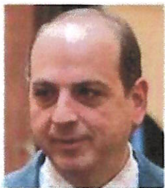
Il presidente Antonio Visconti

© la Citta di Salerno 2024 Powered by TECNAVIA