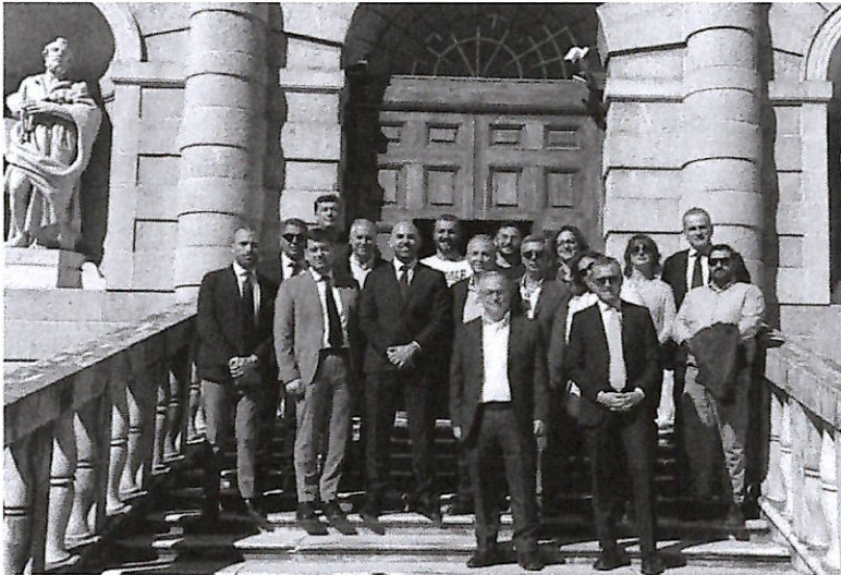
L'incontro a Padula

Il sottosegretario alle Infrastrutture e Trasporti Tullio Ferrante ieri, dopo aver visitato l'ospedale di Polla "Luigi Curto", si è recato a Padula per ricambiare la visita istituzionale avvenuta un anno fa, da parte dei rappresentanti istituzionali del territorio, incentrata sulla questione dell'Alta Velocità. A questo proposito, Ferrante ha assicurato che il "lotto 1B-1C della linea ferroviaria dell'Alta Velocità Salerno-Reggio Calabria è in avanzata fase autorizzativa". Ricordando, tra l'altro, che proprio qualche giorno fa è stato espresso il parere della Commissione Pnrr-Pniec