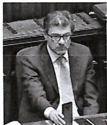
▲ Giancarlo Giorgetti Ministro dell'Economia

Il conto è salato. L'importo preciso sarà definito a fine mese, quando il Dipartimento delle Finanze del Mef conoscerà l'incasso del concordato preventivo biennale, l'accordo tra le partite Iva e l'Agenzia delle Entrate che congela le tasse e i controlli per due anni. Più alto sarà il gettito, anche di altre «maggiore entrate» che non sono state ancora rese note, e minore sarà il contenimento della spesa pubblica. Tasse e tagli: le risorse da recuperare ammontano in tutto a 15 miliardi. Aumenteranno i tagli ai ministeri