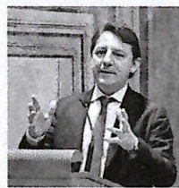
Pasquale Tridico, M5S

«100 miliardi di euro di contributi a fondo perduto, destinati solamente al settore automotive e alle aziende in crisi. Dovrà funzionare esattamente come la cassa integrazione a fronte della sospensione del rapporto di lavoro e per integrare la riduzione d'orario. Durerà due anni ed in questo modo potremo dare una chance all'industria europea dell'auto mettendola nelle condizioni di affrontare meglio la crisi, a condizione però