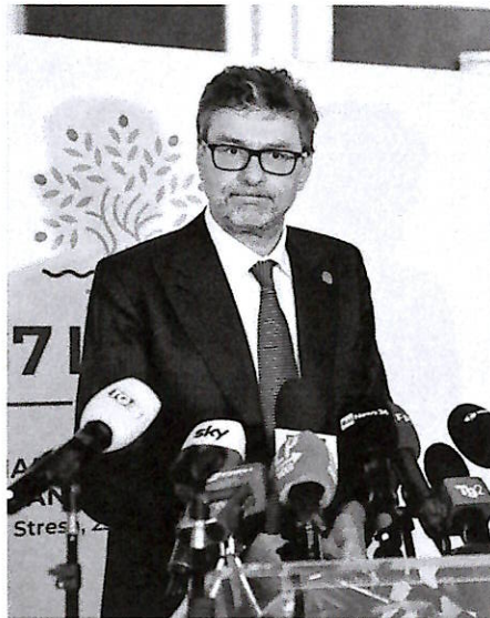
Verso la manovra Il ministro dell'Economia Giancarlo Giorgetti fra costi e obiettivi di crescita

Poi ci sono gli incentivi, anche questi da confermare, a favore dei premi di produttività e l'ipotesi di applicare una tassa piatta agli straordinari e si ragiona sulle risorse da destinare a chi assume e crea posti di lavoro cercando in questo modo di confermare la maxide-