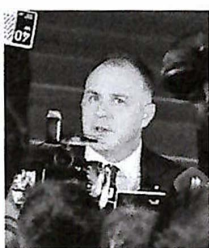
Il presidente Emanuele Orsini

«L'industria italiana non è lontana o contro ambiente, anzi noi siamo in Champions League: già nel 2021 sul tema riciclo si è ottenuto ciò che ci veniva chiesto per il 2030. Noi siamo virtuosi e i nostri consumatori ce lo chiedono. Ma la verità è che non esiste cambiare tecnologie per un emendamento o per un'ideologia. Noi abbiamo un know how all'avanguardia da salvaguardare in molti settori e per farlo crediamo sia necessario porre al centro la questione della neutralità tecnologica». Così il presidente di Confindustria Emanuele Orsini, nel suo intervento durante l'assemblea di Federacciai presso la fiera di Vicenza. «Abbiamo dei know how da salvaguardare. E siamo preoccupati. Abbiamo bisogno di interloquire con i nostri europarlamentari. Alcune norme devono essere ripensate», ha detto ancora Orsini.