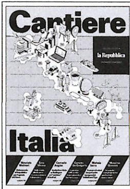
▲ Cantiere Italia/2 Lavoro L'inchiesta di Repubblica

Guardando ai mesi a venire ci sono ragioni di essere ottimisti: la carenza di manodopera e il calo dell'inflazione giocano a favore dei lavoratori. Potremmo essere ancora più positivi se, diversamente da quanto avvenuto finora, le politiche pubbliche provassero a superare la dicotomia occupato/disoccupato e riconoscessero l'esistenza e la rilevanza di una zona grigia tra lavoro e non lavoro che merita decisamente più attenzione di quella ricevuta finora.