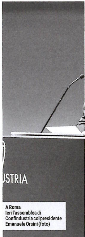
A Roma leri l'assemblea di Confindustria col presidente Emanuele Orsini (foto)

per legge. Noi - aggiunge Orsini - difendiamo il principio che il salario si stabilisca nei contratti, trattando con il sindacato». Ma la vera preoccupazione, il chiodo fisso, resta il Green deal: «La filiera italiana dell'automotive è in grave difficoltà, depauperata del proprio futuro dopo aver dato vita alle auto più belle del mondo e investito risorse enormi per l'abbattimento delle emissioni. Stiamo regalando alla Cina il mercato dell'auto». Il feeling con Meloni nasce qui: la premier definisce lo stop ai motori endotermici nel 2035 «autodistruttivo» per l'economia europea. E apre le porte agli imprenditori: «Con me avrete un confronto leale e regole certe, non andremo sempre d'accordo ma l'Italia può ancora stupire se lavoreremo insieme». Le critiche per la cancellazione del Superbonus per la premier sono acqua passata: «Abbiamo detto dei no perché non si butano dalla finestra i soldi dei cittadini, è finita la stagione dei bonus». Ora, insiste, è il momento della lotta comune alla burocrazia - «mi sento come uno di voi quando vedo gente che fa di tutto per non risolvere i problemi» - e occorre aumentare la produttività del lavoro. «L'obiettivo della cre-