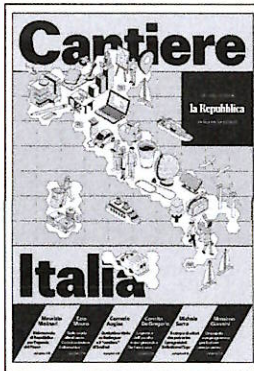
▲ Cantiere Italia/2 Lavoro L'inchiesta di Repubblica

Negli ultimi anni la tecnologia, e più recentemente l'IA, ha dato un'accelerazione ai normali processi di evoluzione e cambiamento nell'organizzazione del lavoro. Una sfida senza precedenti per tutti: imprese, istituzioni, lavoratori. Le prime sono state chiamate a ripensare tempi e organizzazione del lavoro. Per i la-