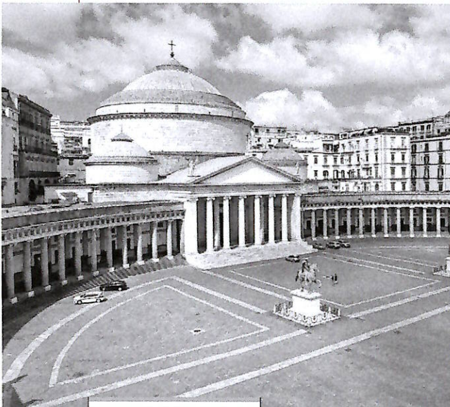
📍 I luoghi del G7 a Napoli Nella foto sopra, Piazza Plebiscito A destra in alto lo Scalone d'onore del Palazzo Reale Sotto, il Salone della meridiana del Museo Archeologico