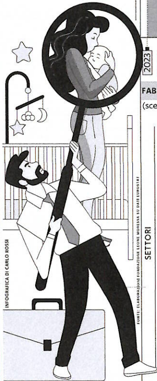
INFOGRAFICA DI CARLO ROSSI