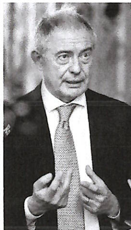
▲ Il ministro Adolfo Urso è responsabile delle Imprese e del Made in Italy

Il ministro: "Sull'auto confronto serrato" Conferma ai sindacati "Forte attenzione" sul destino della società di robot ceduta al 50%