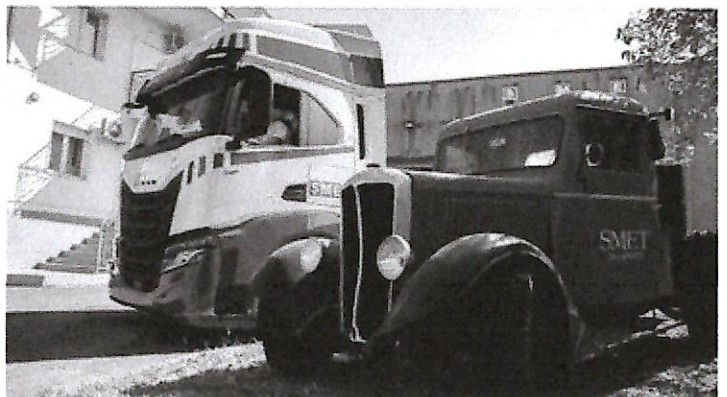
Il Gruppo Smet ha celebrato settantasette anni di storia