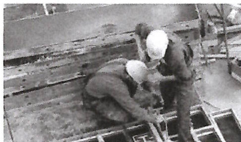
Operai edili impegnati in un cantiere