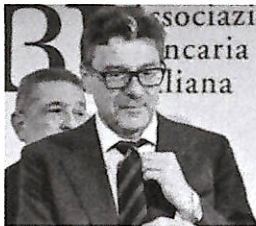
▲ Giancarlo Giorgetti Ministro dell'Economia

L'Eurogruppo prevede restrizioni di bilancio Pressioni sull'Italia "Deve ratificare il Mes"