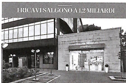
IRICAVI SALGONO A 1,2 MILIARDI

Secondo Confesercenti le rilevazioni Istat «confermano come un target di crescita