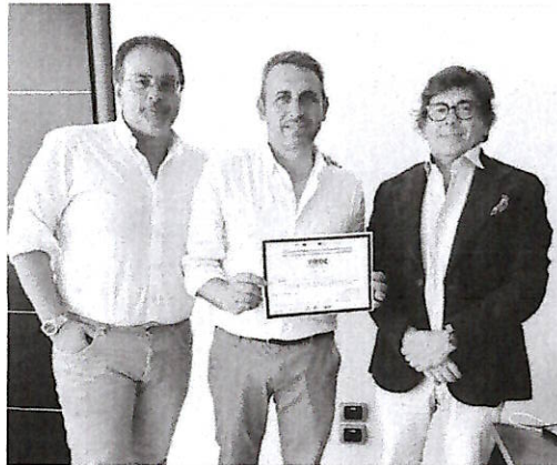
Un momento dell'accordo

zione, assistenza tecnica per intercettare finanziamenti e anche altre opportunità come programmi di open innovation". Il compito di Pride è quello di assicurare la transizione digitale delle imprese attraverso l'adozione delle tecnologie digitali avanzate: Intelligenza Artificiale, Calcolo ad Alte Prestazioni, Sicurezza Informatica. "I nostri servizi, la collaborazione con Salerno Pulita sono certo rappresenteranno una opportunità per i cittadini. E' questo l'obiettivo di fondo: governare le tecnologie per assicurare servizi smart". L'attestato certifica che le aziende hanno beneficiato del servizio Tscd - Technology Audit and Concept Development Service e che alle stesse è stato consegnato il Progetto di Trasformazione Digitale preparato dal team del partenariato che anima Pride. Il Campania Digital Innovation Hub - Rete Confindustria Scarl, è capofila del progetto. Gli altri partner di Pride sono il Consorzio "Meditech - Mediterranean Competence Center 4 Innovation", il