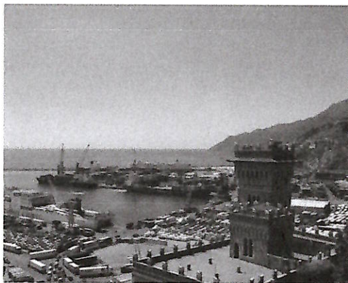
Porto di Salerno