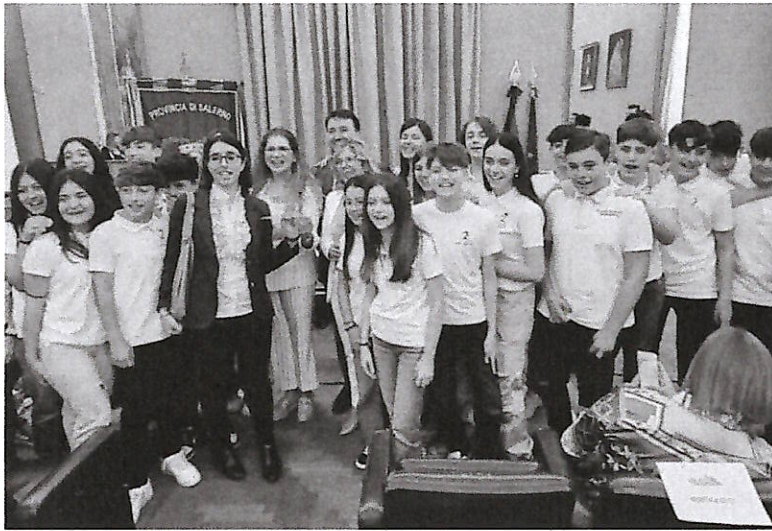
L'evento in Provincia

Ieri mattina, presso il Salone Bottiglieri di Palazzo della Provincia di Salerno, ha avuto luogo la premiazione dei progetti vincitori della terza edizione di "Siamo Pari", il concorso di idee finalizzato a favorire la diffusione e la cultura della parità di genere nelle scuole primarie e secondarie di primo grado di Salerno e provincia. L'iniziativa è promossa dal Gruppo Giovani Imprenditori e dal Comitato Femminile Plurale di Confindustria Salerno, in collaborazione con la Fondazione della Comunità Salernitana ed è patrocinata da Comune e Provincia di Salerno, Camera di Commercio di Salerno e Ufficio Scolastico Regionale per la Campania