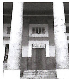
La prima Municipalità

In cima ai problemi che peseranno maggiormente sul futuro dell'Italia c'è la "fragilità della sanità pubblica". "Deve far riflettere che l'80 per cento, al Nord come al Sud, siano preoccupati dalla sanità", commenta Stefano Consiglio, presidente della fondazione Con il Sud: "Emerge un'attesa: che lo Stato ascolti e coinvolga imprese e terzo settore. Dopotutto 8 italiani su 10 ritengono che il ritardo economico e sociale del Sud blocca la crescita del Paese. Ma ne usciamo soltanto insieme, nei fatti e non a parole".