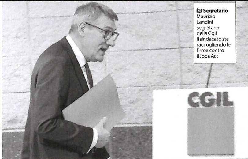
Segretario Maurizio Landini segretario della Cgil. Il sindacato sta raccogliendo firme contro il Jobs Act

«La logica di ridurre le tutele ai garantiti anziché allargarle ai non garantiti ha prodotto una precarietà senza precedenti nella storia d'Italia e senza paragoni nell'Europa industrializzata. Si è affermata una legislazione del lavoro che nulla ha a