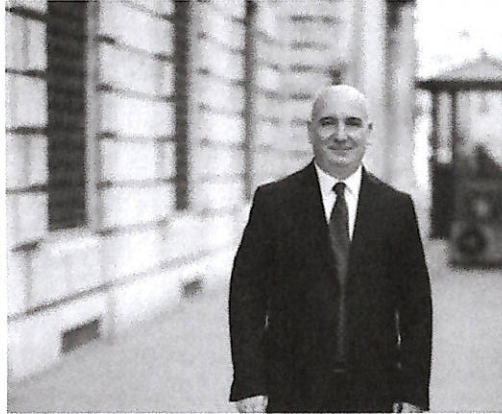
L'onorevole Pino Bicchielli

"Salerno non merita questa insicurezza": così il vicepresidente di Noi Moderati alla Camera dei Deputati l'onorevole Pino Bicchielli in merito agli ultimi episodi di furti che si sono registrati sul territorio cittadino e che, in particolar modo, hanno colpito la zona orientale e Parco Arbostella con danni economici importanti. Il deputato salernitano ha annunciato che presenterà una interrogazione parlamentare al ministro dell'Interno e già nei prossimi giorni chiederà un incontro al prefetto Francesco Esposito per valutare tutte le azioni da mettere in campo e ridare sicurezza ad un territorio che oggi, sempre più spesso, finisce nel mirino di malviventi e criminali, anche come conseguenza di un'assenza di controlli ormai preoccupante. "Come governo nazionale abbiamo implementato le risorse per Strade Sicure, utilizzando i nostri militari ma a Salerno ormai da troppi anni si vive male, insicuri e questo noi non ce lo possiamo permettere- ha detto l'onorevole Bicchielli - Il Comune ha delle responsabilità importanti in questa città ma si percepisce anche un degrado culturale che porta inevitabilmente alla violenza. Il