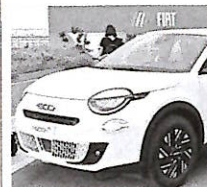
Una Fiat 600

mo accelerato, del 14,8% a 108.552 unità, le immatricolazioni di auto elettriche, con una quota di mercato stabile intorno al 12%. Ma questo non vale per l'Italia, dove già le e-car sono da sempre il punto debole delle vendite di auto nuove, e in aprile sono scese al 2,4% perché i potenziali clienti rinviavano gli acquisti, in attesa del decreto sugli Ecobonus. Sono previsti incentivi fino a 13.750 euro per acquistare un'auto elettrica nuova se si rottama una macchina vecchia, da Euro 0 fino a Euro 2, e si ha un reddito familiare inferiore a 30 mila euro. L'Unrae (i rappresentanti di autoveicoli esteri) ribadisce l'urgenza degli incentivi: «Inspiegabilmente a distanza di quasi quattro mesi dalla presentazione e sei mesi dal primo annuncio, e dopo ben tre passaggi alla Corte dei Conti, il Dpcm non vede ancora la luce», protesta il direttore generale Andrea Cardinale. Il presidente del Centro Studi Promotor, Gian Primo Quagliano, ammonisce che «non è ancora superata la crisi del mercato dell'auto in Europa, iniziata con la pandemia e proseguita con la carenza di componenti auto e con il ritorno dell'inflazione». —