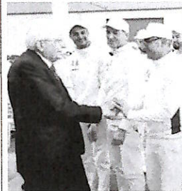
▲ L’incontro con i lavoratori. Sergio Mattarella visita lo stabilimento Granarolo di Castrovillari

nel cassetto dei «problemi non urgenti» è un’opzione che frena il pil di tutto lo Stivale. «Lo sviluppo della Repubblica ha bisogno del rilancio del Mezzogiorno», insiste l’inquilino del Quirinale. «È appena il caso di sottolineare come una crescita equilibrata e di qualità del Sud d’Italia assicuri grande beneficio all’intero territorio nazionale», scandisce fra gli applausi. «Il Mezzogiorno è parte dell’Europa», incalza, chiedendo di uscire da una logica di «analisi semplificate».