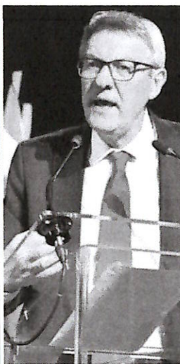
▲ Maurizio Landini Il segretario generale della Cgil

bisogno di un governo che garantisca diritti e tutele 365 giorni l'anno, non di uno spot il Primo Maggio».